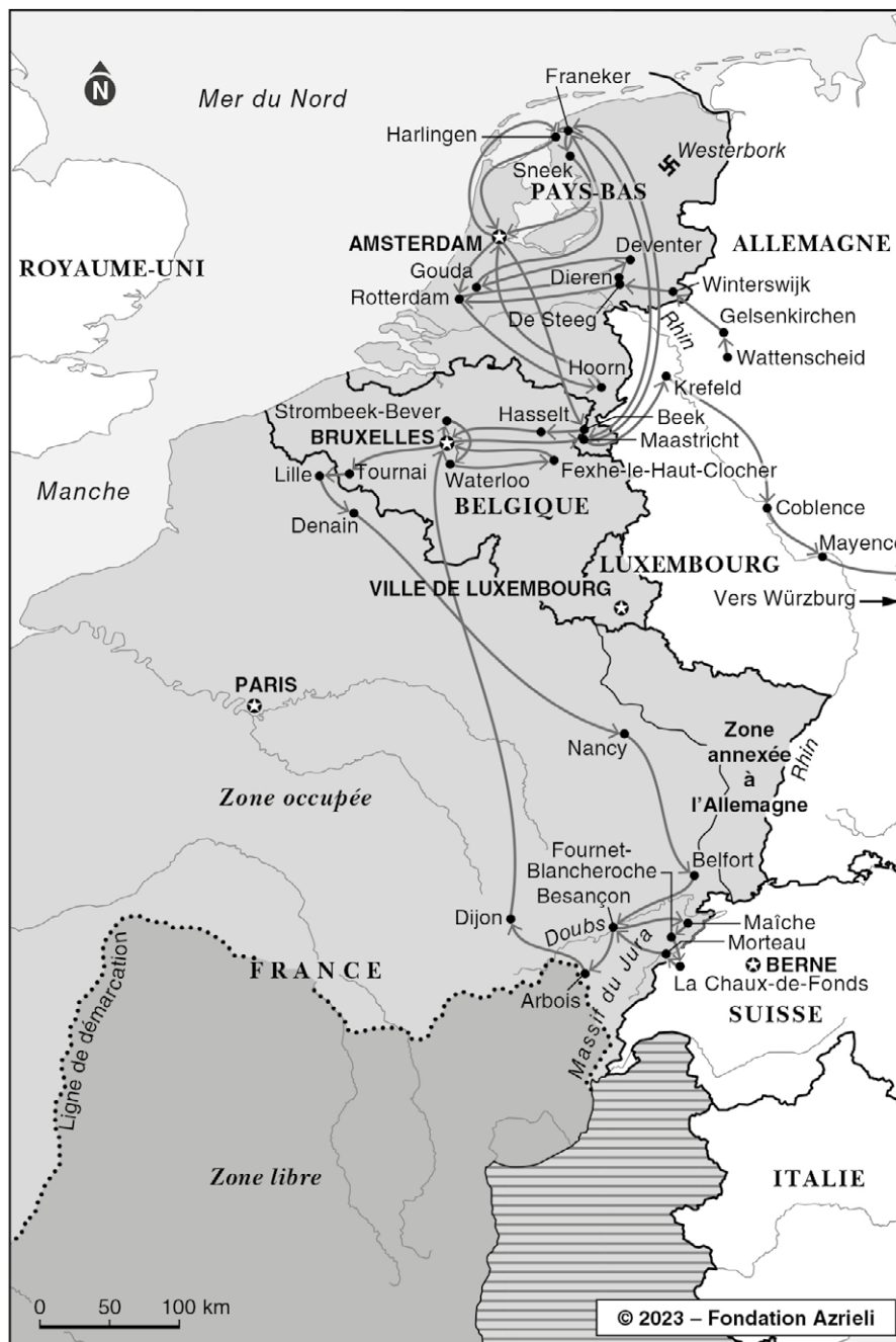
PARCOURS DE MORRIS SCHNITZER EN EUROPE OCCIDENTALE